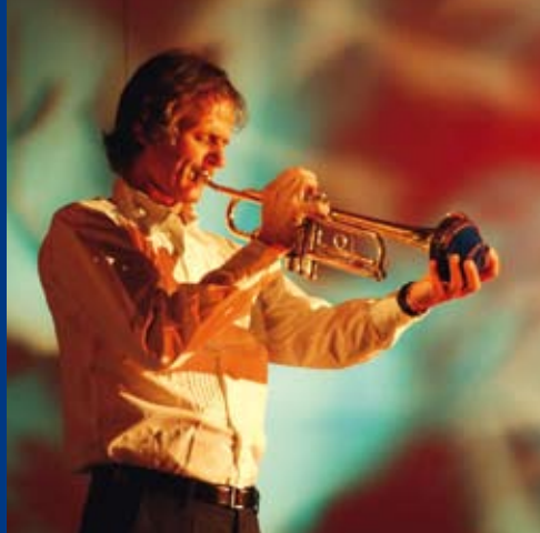
Markus Stockhausen vor Lichtinstallation von Rolf Zavelberg

Anlässlich der „Rheinischen Welt-Ausstellung“ lädt das Wasserquintett zu einem besonderen Erlebnis ein. Die in einer zaubernden Landschaft gelegene, als technisches Denkmal geschützte Staumauer der Neyetalsperre wird durch eine poetische Licht- und Klangperformance temporär neu in Szene gesetzt. Neun Abende lang, jeweils mit Einbruch der Dunkelheit, wird eine magische Symbiose aus Natur und Kultur geschaffen. Die Veranstaltung ist Teil der ganz im Zeichen des Wassers stehenden Veranstaltungsreihe „Was(s)erleben“. Auftakt hierzu war im November 2009 an der Bever-Talsperre in Hückeswagen, die Abschlussveranstaltung findet im Frühsommer 2011 in Radevormwald statt.