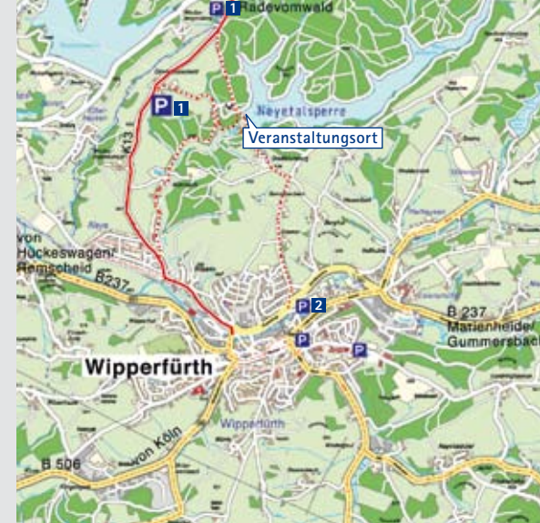
© Oberbergischer Kreis – Geoinformation und Liegenschaftskataster

Der Eintritt ist frei; eine vorherige Anmeldung nicht notwendig. Wir bitten von Fotografieren, Video- und Audioaufzeichnungen abzusehen. Aus Sicherheitsgründen ist der Weg über die Talsperrenmauer während den Veranstaltungen gesperrt.