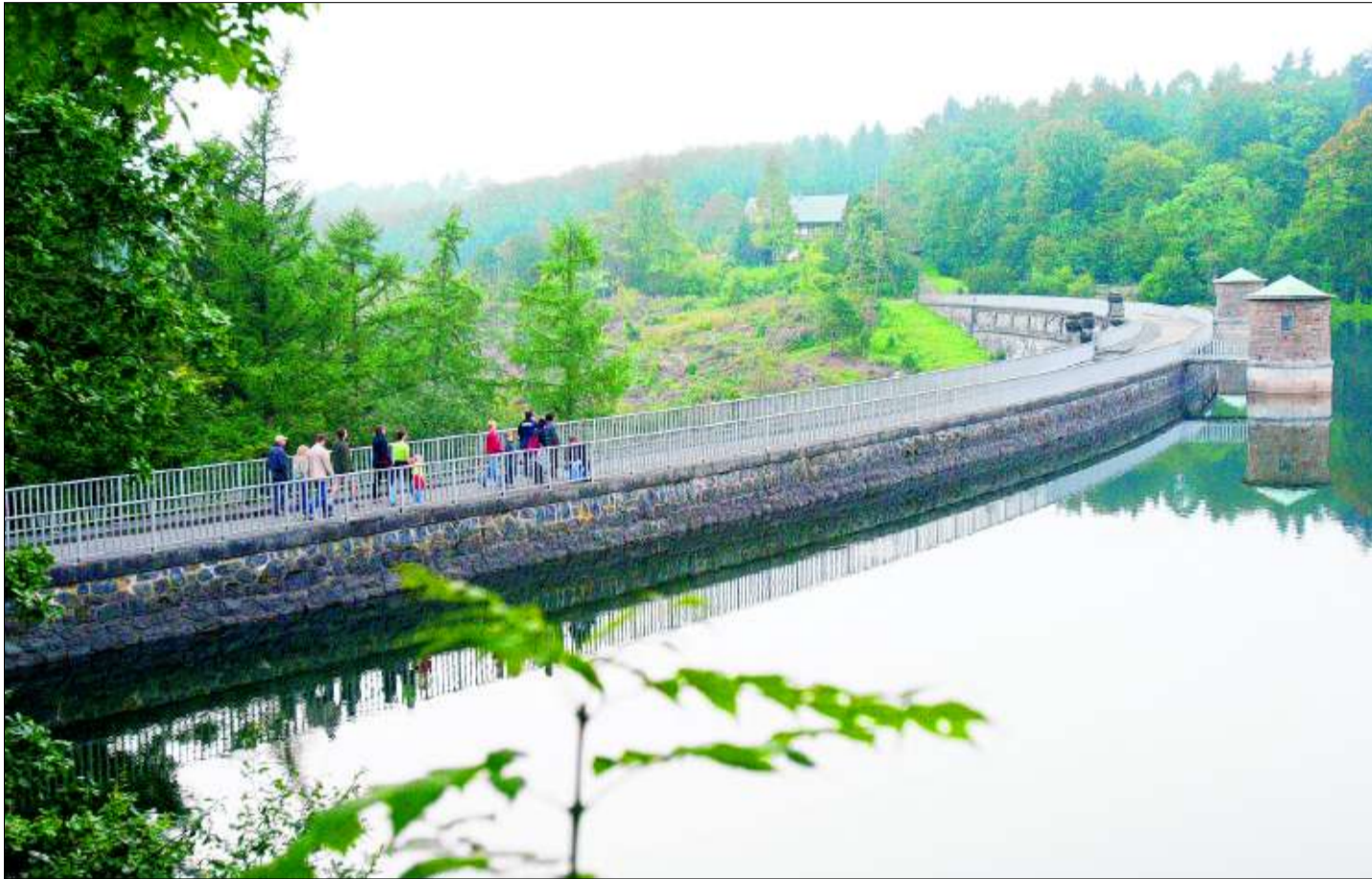
Wanderer auf der Staumauer der Neye-Talsperre.