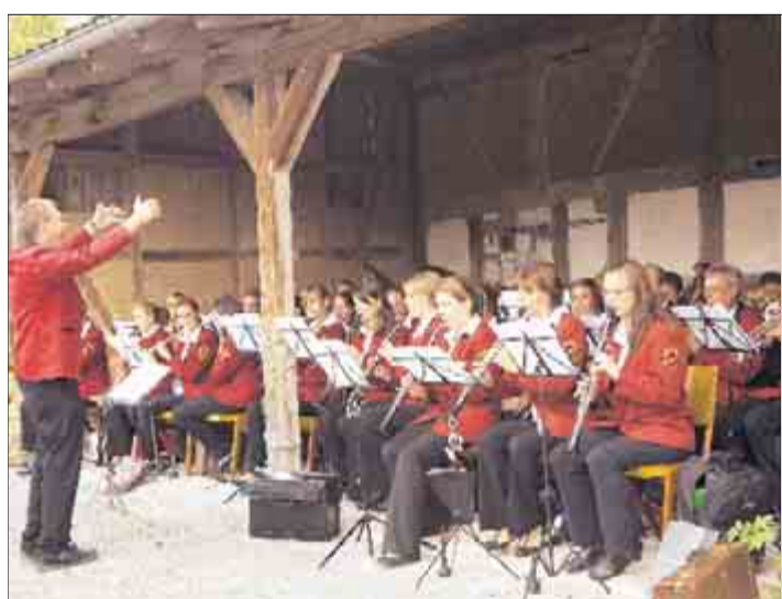
Gut gelaunt: Der Musikverein Süng hatte Spaß beim Auftritt im Freilichtmuseum.