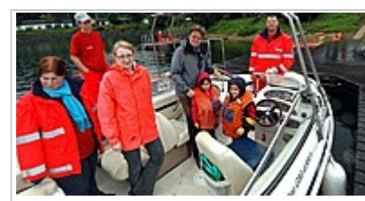
Die Rundfahrten am so genannten „Entdeckernachmittag“ mit dem 70 PS starken Rettungsboot der DLRG war immer wieder ein spannendes und auch aufregendes Erlebnis.