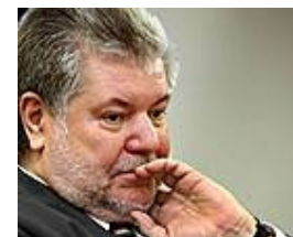
++ Ticker ++ Forscher erklärt