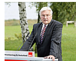
Widerstand Beck stemmte sich gegen Münze