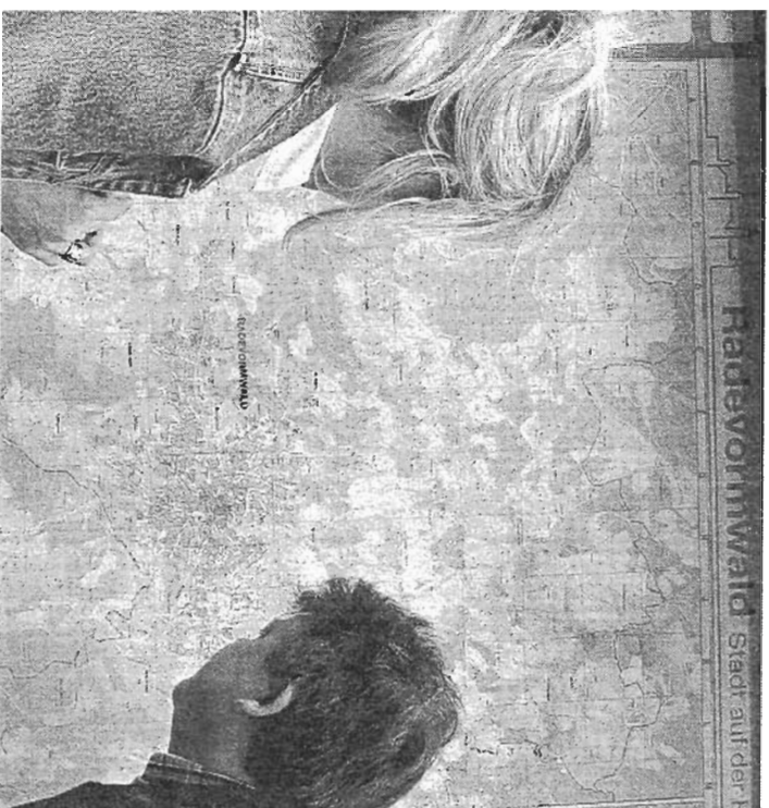
Der Wanderweg wird auf den Stadtkarten gezeigt. Jedoch können jetzt individuelle Pläne im Internet ausgedruckt werden.